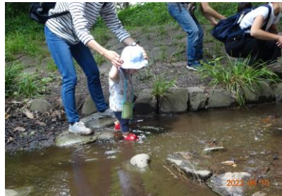
2) 勇気を出して、川の流れの中に踏み込んでいきました。