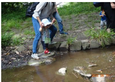
1) 川に入る手前で一瞬立ち止まり、流れを見つめるUさん。

まだ小さなUさんの中に、初めての川も恐れずに渡ろうとする「 挑戦心 」や「 勇気 」があることに驚かされます。その「 挑戦心 」や「 勇気 」はどこからわいてくるのでしょうか？それは後ろでお母さんがちゃんと見ていてくれるという「 安心感 」からです。この「 安心感 」があるからこそ、ちょっと難しいことにも「 挑戦 」でき、 子どもは成長していく のですね。