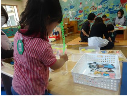
1) ゆらゆら揺れるチェーンリングの先を 容器の入り口に慎重に近づけていきます。

* 長いチェーンリングを、狭い入り口の容器に入れる 難しい課題に挑戦 しているLさん。 何度も失敗しながらも、両手を器用に使って、とても集中して取り組んでいます。