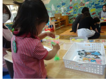
2) 何度も何度もチャレンジして、 ついに成功しました！