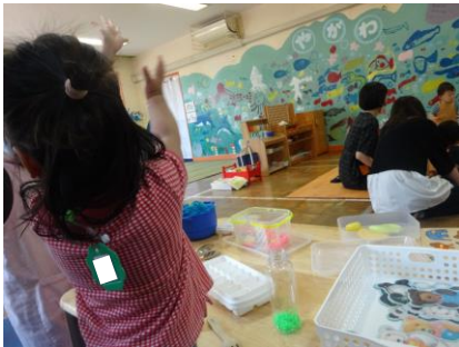
3) やったー、みなさん拍手！